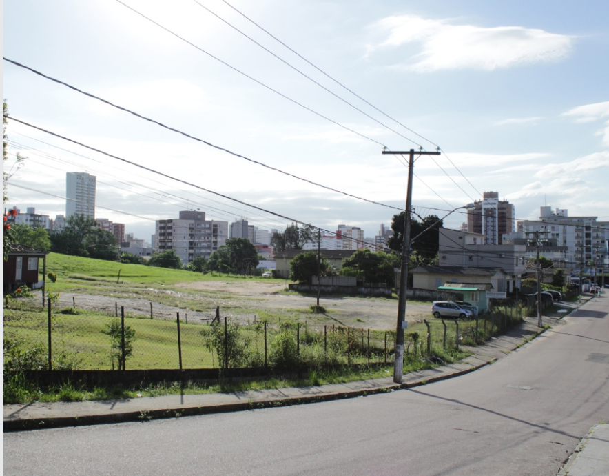
Vista da Rua Conselheiro Henrique Dalsasso para o recorte.