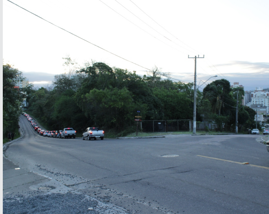
Vista da esquina Rua Defendi Casagrande com Rua Conselheiro Henrique Dalsasso para o recorte.