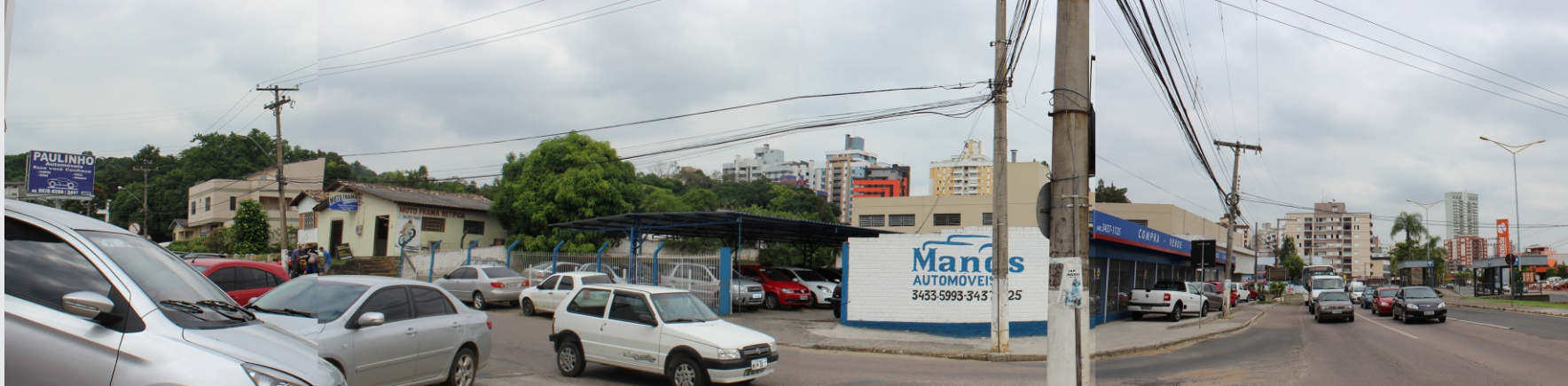
Vista da esquina Av. Centenário com Rua Conselheiro Henrique Dalsasso para o recorte.