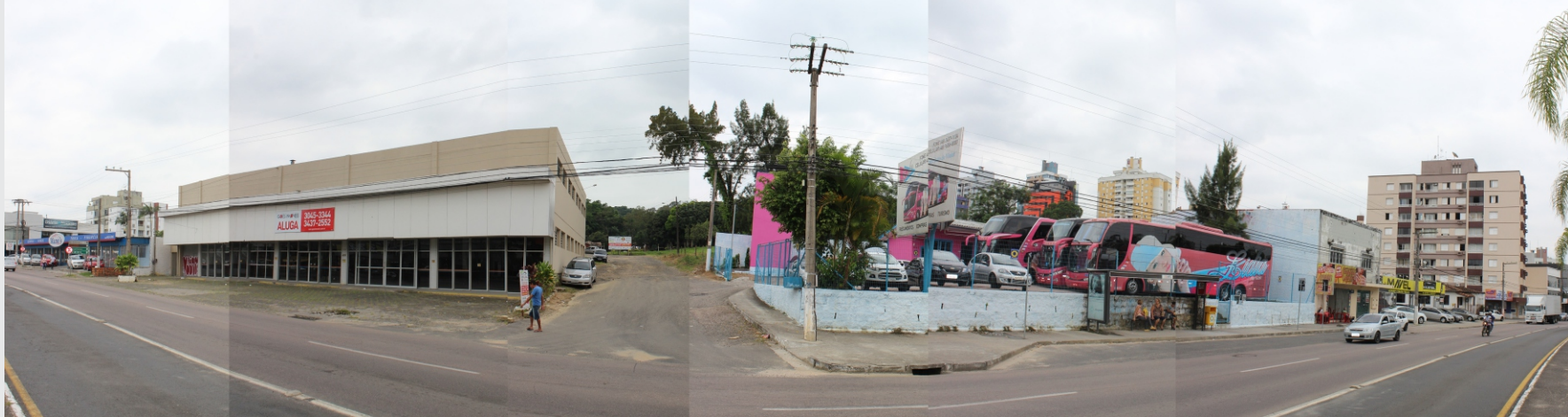
Vista da Av. Centenário para o recorte.

Apesar de ser um terreno com clara chance de também ser tomado pela especulação imobiliária, tornando-se um espaço privado, majoritariamente impermeabilizado, e com a implantação de edifícios com elevados gabaritos construídos por quem, praticamente, só vislumbra o lucro, este raro vazio urbano pode ser uma oportunidade para gerar um espaço e equipamento público na região central de Criciúma, que considere, respeite e utilize como recursos de projeto as questões ambientais envolvidas, de curso de água e vegetação existente.