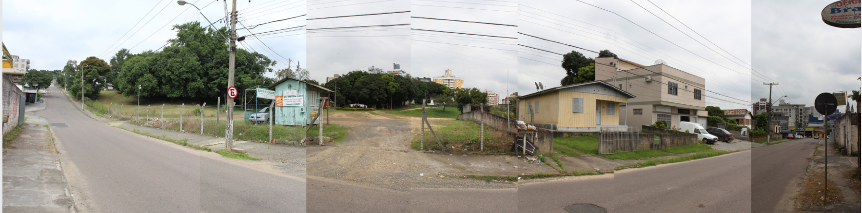
Vista da Rua Conselheiro Henrique Dalsasso para o recorte.